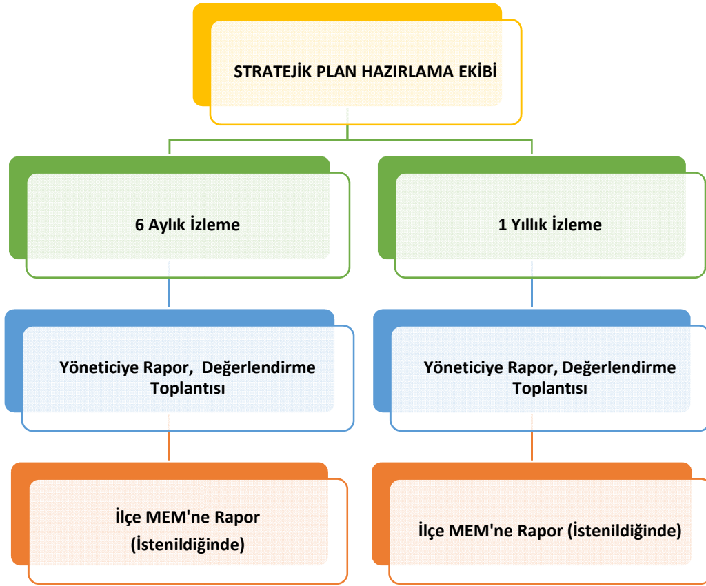
Şekil 3: İzleme ve Değerlendirme Süreci

Müdürlüğümüzün 2019-2023 Stratejik Planı İzleme ve Değerlendirme sürecini ifade eden İzleme ve Değerlendirme Modeli hazırlanmıştır. Okulumuzun Stratejik Plan İzleme-Değerlendirme çalışmaları eğitim-öğretim yılı çalışma takvimi de dikkate alınarak 6 aylık ve 1 yıllık sürelerde gerçekleştirilecektir. 6 aylık sürelerde Okul Müdürüne rapor hazırlanacak ve değerlendirme toplantısı düzenlenecektir. İzleme-değerlendirme raporu, istenildiğinde İlçe Milli Eğitim Müdürlüğüne gönderilecektir.